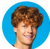
Jannik Sinner, global brand ambassador di pasta De Cecco (pag. 66)

Insieme nello sport e nella vita per essere numeri uno